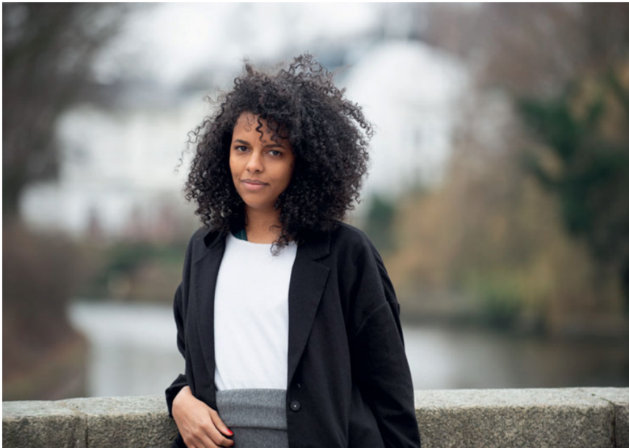
„Niemand wünscht sich, dass es Rassismus gibt. Aber man muss begreifen, dass Rassismus nicht einfach mit guten Intentionen verschwindet, sondern es tatsächlich Arbeit ist.“

sinnig interessant, aber meist schwer zugänglich, weil sie oft sehr akademisch sind. Oder es sind Bücher, die emotional aufgeladen sind und spannende Anekdoten liefern, jedoch ohne Einordnung in größere Zusammenhänge. Diese Dinge hängen aber zusammen, ich wollte hier eine Brücke schlagen.