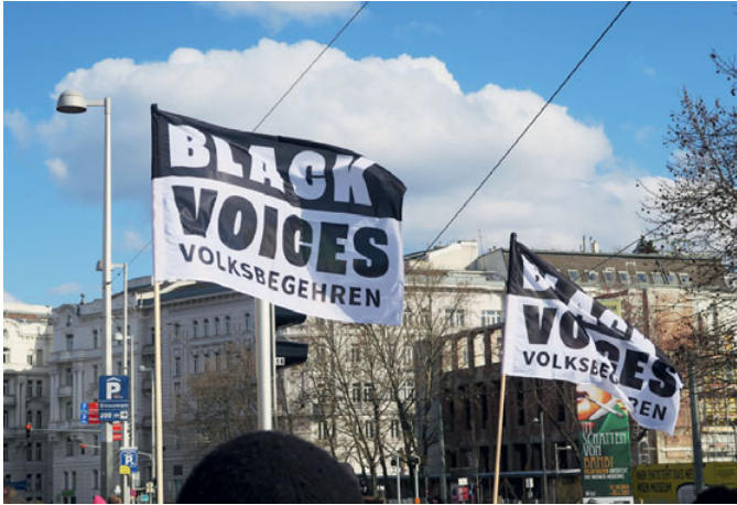
So viel Solidarität wie noch nie, das Momentum soll mitgenommen werden.