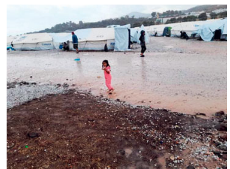
Von der Regierung angekündigt, aber nie errichtet: Kinderbetreuungsstätte in Kara Tepe.

Die von der österreichischen Politik angekündigte Kinderbetreuungsstätte im Lager Kara Tepe ist nie errichtet worden. Schlimmer noch: Die Kinderbetreuungsstätte, die es bisher außerhalb des Lagers gab, wurde geschlossen. Den Menschen im Lager geht es katastrophal. Die Lager-Evakuierung und Aufnahme der Geflüchteten ist dringend notwendig.