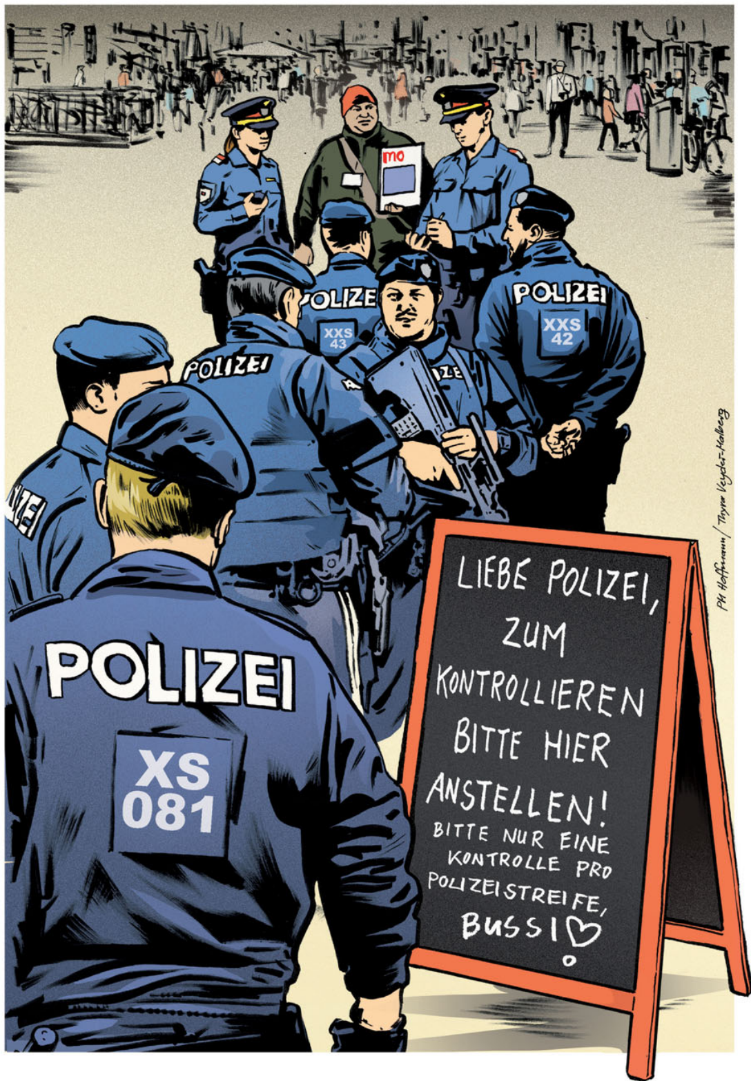
Illustration: P.M. Hoffmann, Text: Thyra Veyder-Malberg