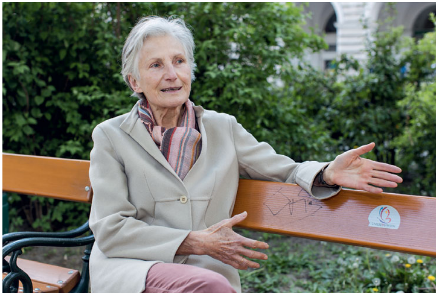
„Die Verfahren der abgeschobenen georgischen und armenischen Familie sind abgeschlossen. Auch wenn das Urteil falsch ist.“

rung der Kinderrechte zusammen. Tatsächlich hat der Verfassungsgerichtshof schon mehrmals aufgetragen, dass das Kindeswohl berücksichtigt werden muss. Das ist keine unverbindliche Regelung, an die man sich halten kann, wenn man will. Das ist Verfassungsrecht und steht über dem einfachen Gesetz. Und natürlich muss das BfA oder das Gericht das berücksichtigen.