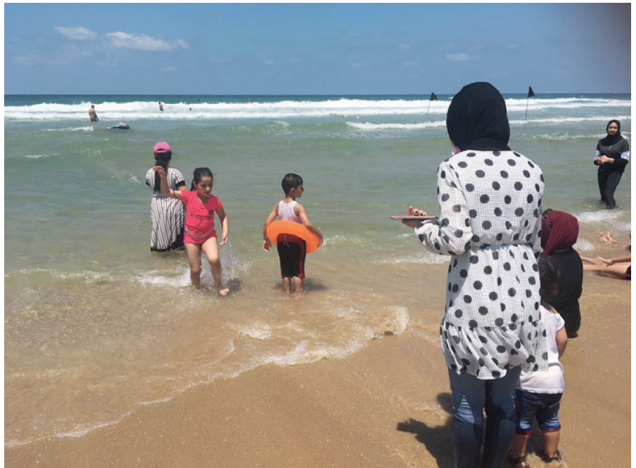
Am Strand von Jaffa: Familien aus Ramallah, das 60 Kilometer entfernt ist, sehen zum ersten Mal in ihrem Leben das Meer. Israel erteilt sehr restriktiv Einreisegenehmigungen, dadurch sind viele Palästinenser*innen vom Meer abgeschnitten, obwohl zum Teil ihre Großeltern noch dort lebten.

Die Aufmerksamkeit habe sich in den vergangenen 20 Jahren verschoben. „Es ist heute viel schwieriger, palästinensische Themen in Medien zu platzieren“, sagt Ramsauer. Einerseits liege das an einer allgemein schwierigeren Ausgangslage für arabische Interessen im Westen – seit 9/11 sei das so. Im Fall der Palästinenser komme noch etwas anderes hinzu: Viele Einrichtungen in NS-Täterländern scheuten davor zurück, das Thema anzugreifen. Auch Medienhäuser zählten dazu. „Man gerät dann schnell auf die Schiene der pauschalen Israel-Kritik“, meint Ramsauer. „Und dieser Vorwurf trifft nie nur die Journalistin, sondern immer auch das ganze Medium.“ Vor der antisemitischen Tendenz, Israel strenger zu bewerten als andere Staa-