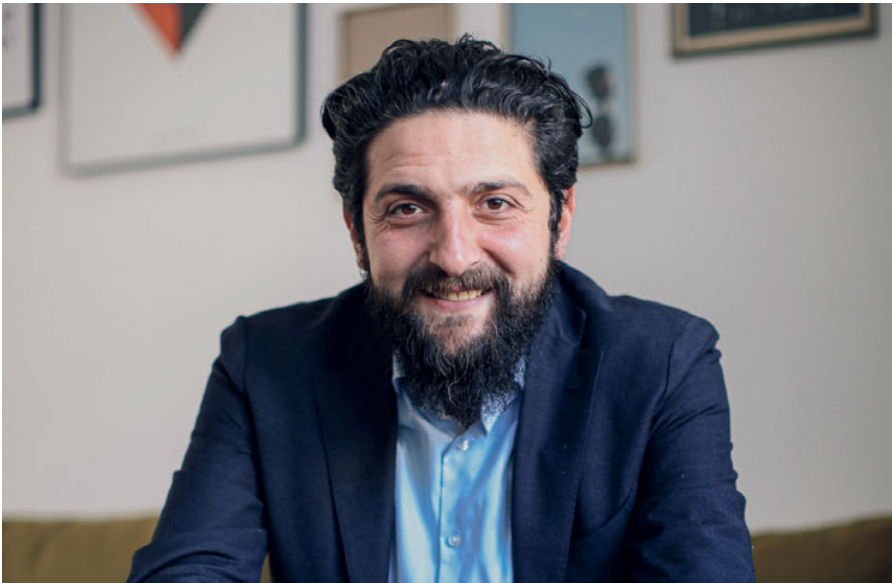
Anfangs wurde meine These in „Das Integrationsparadox“ als provokant oder als optimistisch bezeichnet. Interessant ist, dass seit 2020 das „provokant“ weggefallen ist.

man aufgrund dieser regionalen Begebenheiten auch weniger Möglichkeiten hat, sich in Offenheit gegenüber Fremdem zu üben.