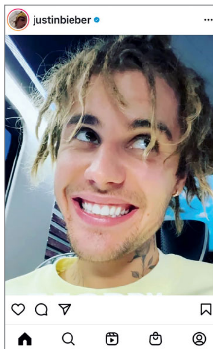
Justin Bieber mit Dreadlocks. Was steht dahinter?

B ei aller Liebe zum Anti-Rassismus: Spätestens beim Thema Cultural Appropriation scheint der Bogen einiger vermeintlich geduldiger weißer Menschen dann doch überspannt, und die Grenze zum Lächerlichen in ihren Augen endgültig erreicht. Einigermaßen lächerlich sind die Beispiele, anhand derer die mediale Debatte rund um kulturelle Aneignung hierzulande geführt wird, dabei tatsächlich oft. Wenn österreichische und deutsche Medien – auch jene, die man allgemein als Qualitätsmedien bezeichnet – zum Thema Cultural Appropriation berichten, dann wird die Thematik meist schon in der Aufmachung mit einer subtilen Note Belanglosigkeit versehen.