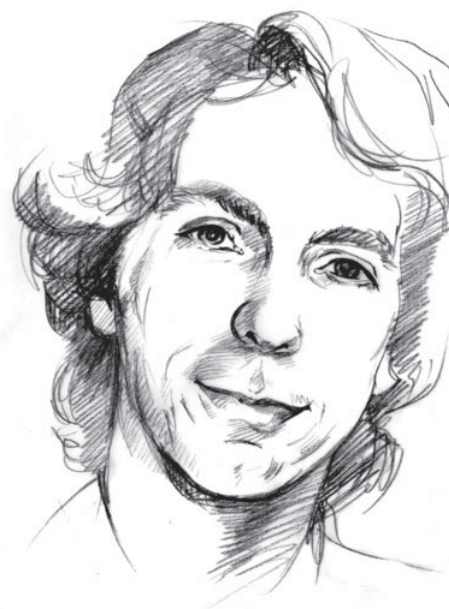
Illustration: Petja Dimitrova

Doch Kategorien wie „Migrant“ oder „Mensch mit Migrationshintergrund“ oder „Mensch mit Name, der nach Mensch mit Migrationshintergrund klingt“ sind denkbar ungeeignet, um konkrete Probleme zu identifizieren oder gar zu lösen. Mit derart diffusen Einteilungen, die ein breites Spektrum