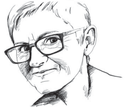
Illustration: Petja Dimitrova

E s hat auch nichts mit einer bestimmten Herkunft oder Nationalität zu tun. Gewalt an Frauen kommt in allen gesellschaftlichen Bereichen und auch Schichten vor. Es ist auch kein Problem, dass nur in sogenannten ärmeren Schichten oder in Arbeiterfamilien oder nur in migrantischen Familien vorkommt. Auch in den oberen Schichten, in den sogenannten „besseren Kreisen“ unserer Gesellschaft kommt Gewalt an Frauen genauso vor. Nicht selten haben es gerade diese Frauen noch viel schwerer sich aus einer Gewaltbeziehung zu lösen, weil ihre Männer oft angesehene Persönlichkeiten wie Politiker, Polizisten, Ärzte oder Rechtsanwälte sind. Männer, die gut vernetzt sind und alle Mittel einsetzen, das Leben ihrer Partnerinnen zu zerstören. Viele dieser Frauen bestätigen uns, dass sie keine Chance bei Gericht und Behörden haben, weil ihnen sowieso nicht geglaubt wird.