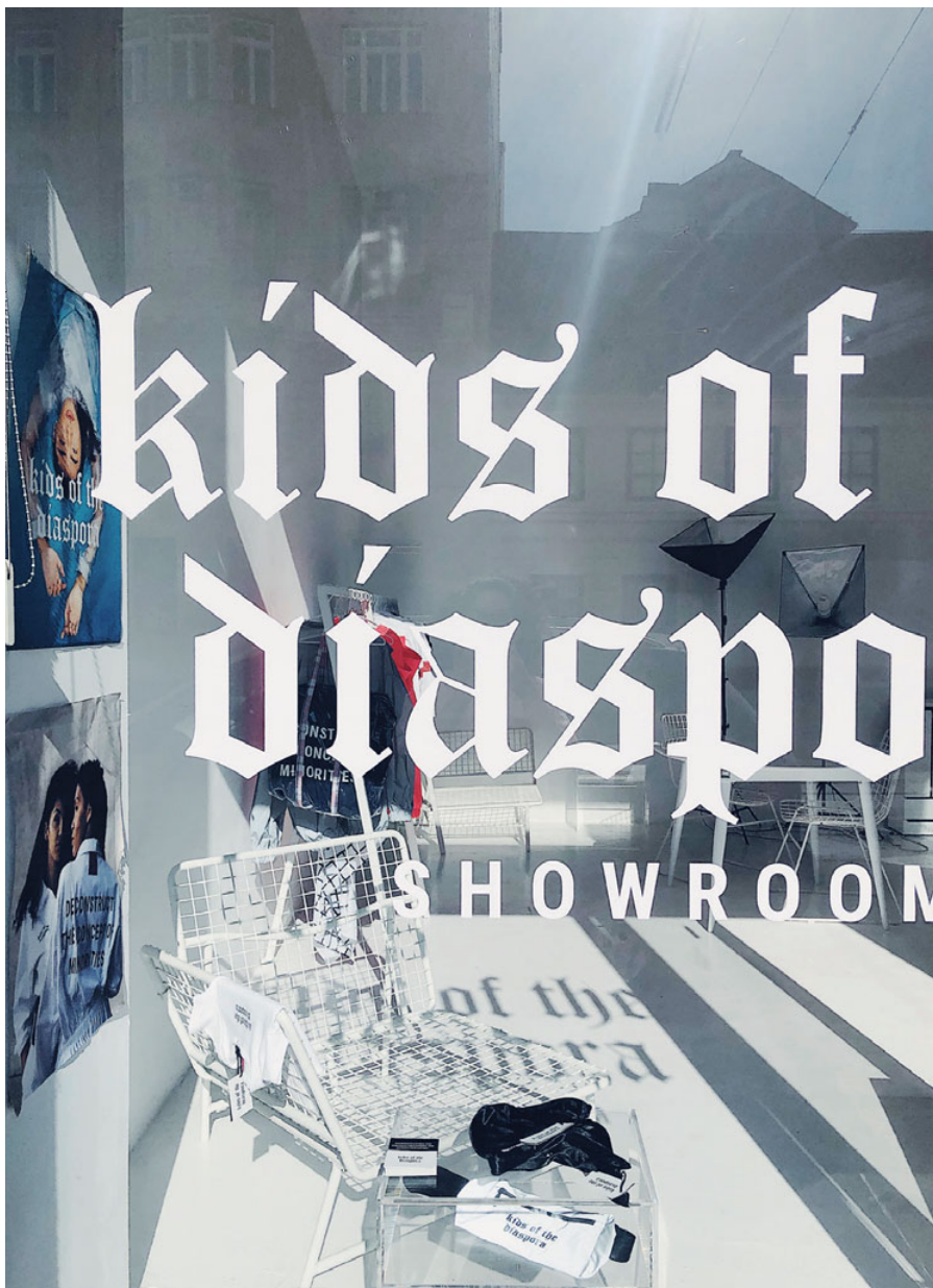
KOTD wird von Wien über New York bis Südafrika getragen.