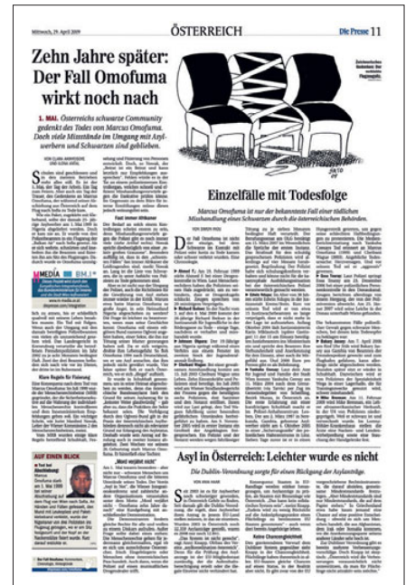
Ziel verschiedener Initiativen im Medienbereich: eine ausgewogene Berichterstattung in Bezug auf Menschen afrikanischer Herkunft in Österreich zu ermöglichen.