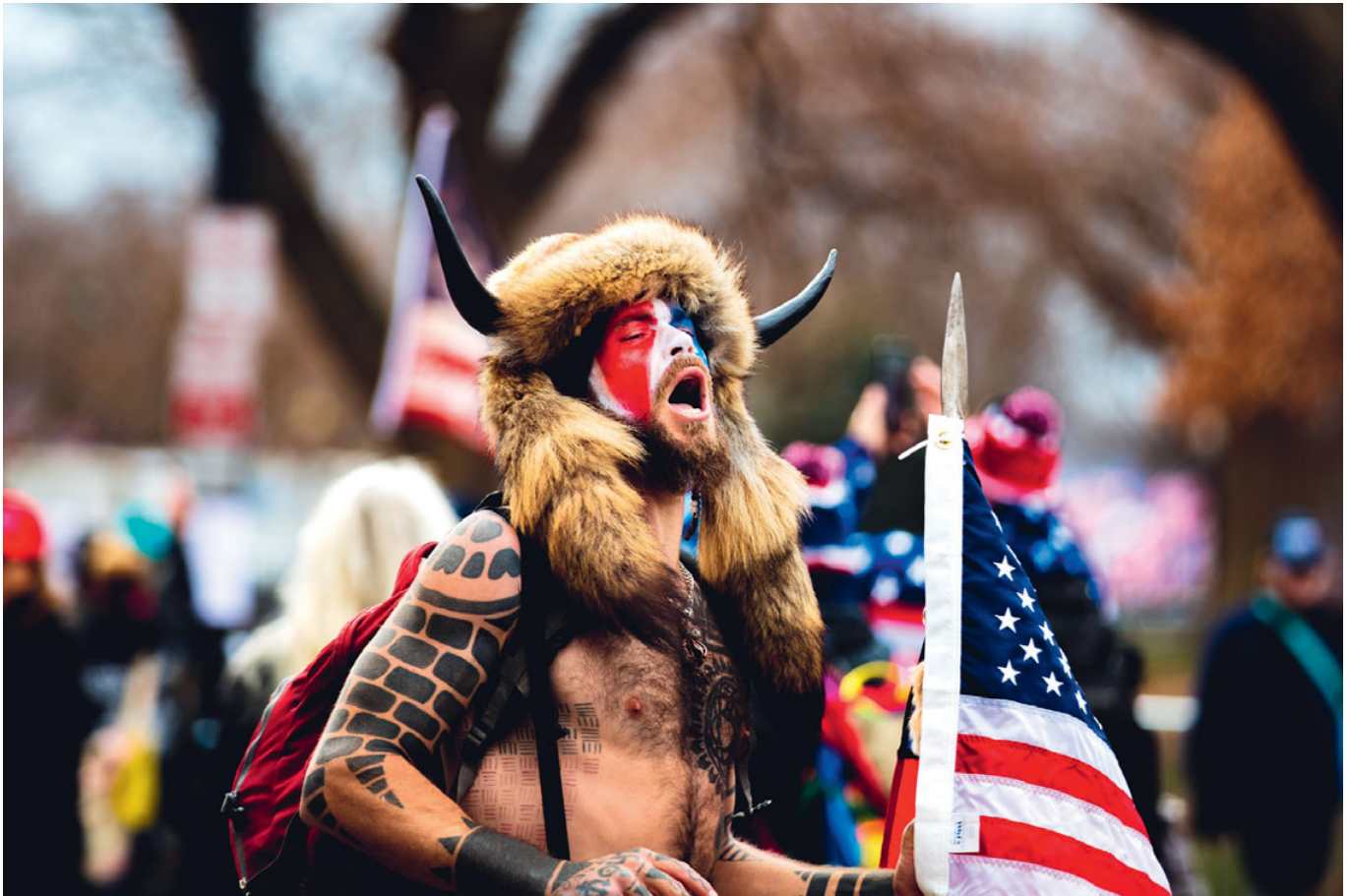
Der Schamane vom Sturm auf das Kapitol: Bizarren Ausdruck davon, welche Dreistigkeit kulturelle Aneignung in Zeiten von QAnon und Querdenker*innen erreicht hat.

nen junger weißer Menschen greifbarer gemacht und dabei vieles an rassistischer Entmenschlichung dekonstruiert haben, ist im Übrigen wohl niemandem besser bewusst, als den Schöpfer*innen dieser Subkulturen selbst. All das kann aber nur funktionieren, solange marginalisierte Gruppen zumindest die Deutungshoheit über ihre kulturellen Kreationen haben und diese nicht zu seelenlosen, gut verkaufbaren Hüllen verkommen lassen müssen.