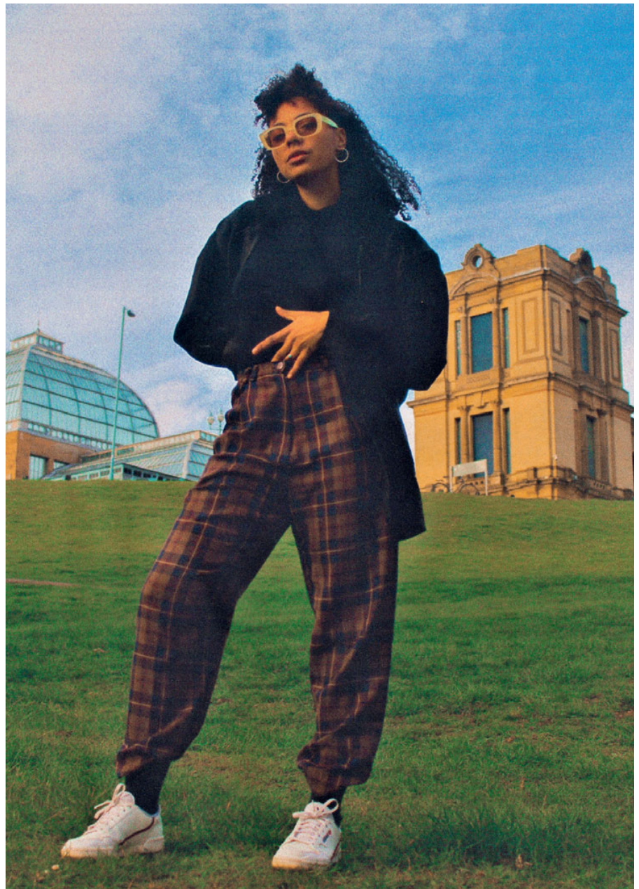
Für ein Schauspielstudium nach London gegangen. Dort gilt Nenda als „light-skinned“.

Ja, auf jeden Fall, weil ich dort als „light-skinned“ gelte. In London bin ich die Privilegierte und da habe ich selten irgendwelche Probleme. Also, dass Leute mich fragen woher ich komme, kommt dort eher von der Schwarzen Community, weil es oft ein Interesse daran gibt, ob wir vielleicht eine ähnliche Herkunftsgeschichte haben. Aber im Grunde ist es in London einfacher für mich, weil