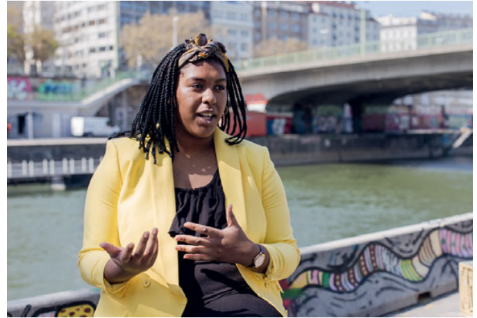
„Struktureller Rassismus ist auch das Problem der weißen Mehrheitsgesellschaft.“