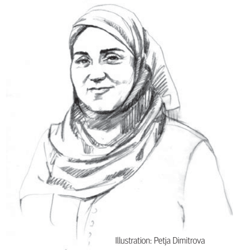
Illustration: Petja Dimitrova

Nachdem die Operation Luxor und die damit zusammenhängenden Geschichten publik wurden, gab es bei mir, sowie in der österreichisch-muslimischen Community innerlich erneut einen Knacks. Es ist nahezu unmöglich dieses Gefühl zu beschreiben, wenn man tagtäglich mit einem Generalverdacht leben muss. Es ist wie das Damoklesschwert, das einen begleitet, man könnte ja schließlich auch ohne etwas Verbrochen zu haben zum Ziel brutaler Amtshandlungen werden oder nicht nachvollziehbar beschuldigt werden. In einer